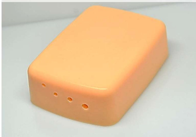
エコー下穿刺トレーニングモデル AKS-AS1